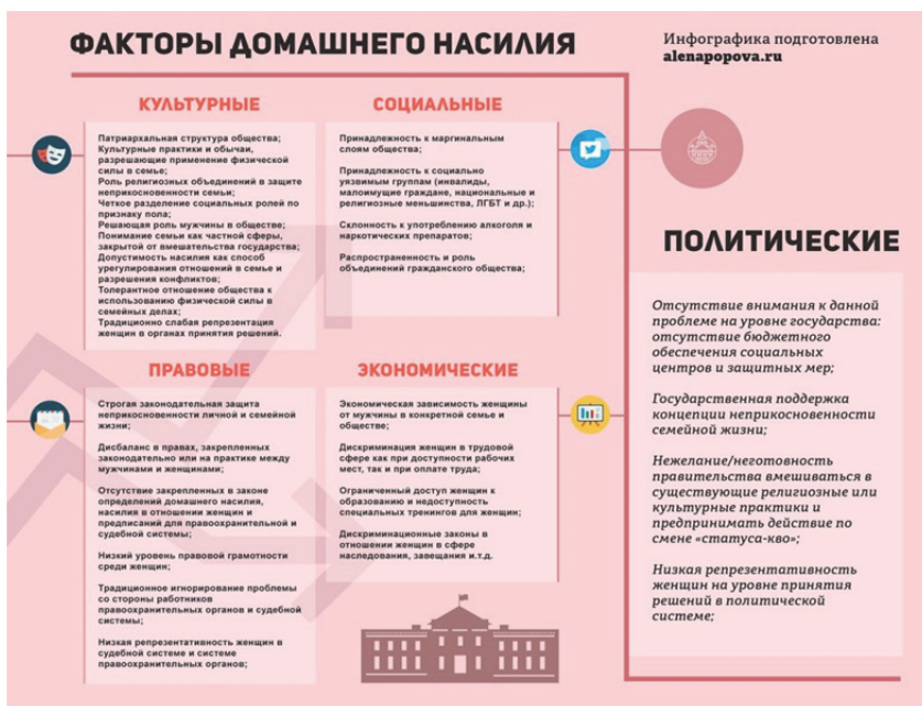
Таблица 2. Классификация факторов насилия в семье (обзор мировых источников)

По мнению некоторых исследователей, в семьях, живущих ниже границы бедности, насилие в семье происходит в два раза чаще, чем в семьях с лучшим экономическим положением. Тем не менее, нужно понимать, что бедность не является прямой причиной насилия в семье, а является провоцирующим фактором. Известно, что насилие может совершаться и в материально обеспеченных семьях, и может не происходить при ограниченных финансовых возможностях семьи, т.е.