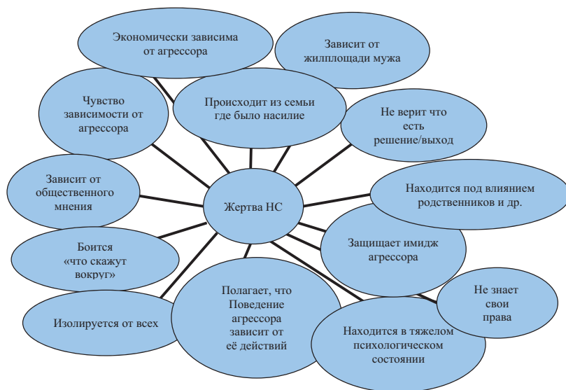
Рисунок 1. Портрет жертвы насилия в семье (по результатам описаний пострадавших, опрошенных в рамках индивидуальных интервью)

Интересно отметить, что пострадавшие, которые вышли из ситуаций насилия, ввиду способности адекватно оценить свой прошедший жизненный опыт, подтвердили, что только после выхода из ситуации насилия смогли осознать отсутствие их собственной вины в агрессивном поведении мужа. Они смогли проанализировать, что независимо от их поведения/действий, поведение агрессора не менялось, т.е. даже при их высокой степени покорности и подчинения агрессору, они всё равно подвергались насилию, при этом их всегда обвиняли в том, что они, якобы, «спровоцировали» насилие. Психологи объясняют типичное такое поведение агрессоров по принципу «лучшая защита – нападение».